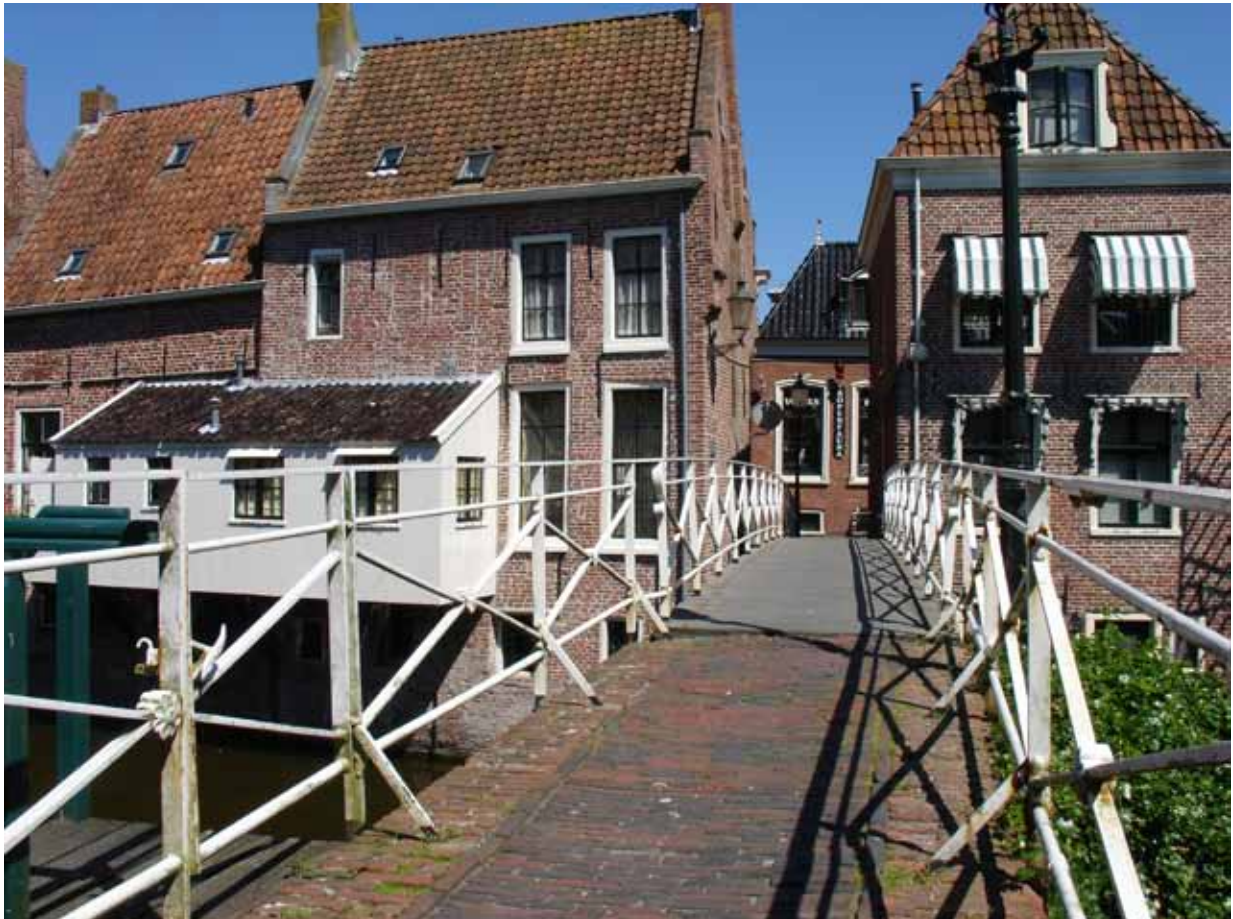
Historisch Centrum Appingedam

Oterdum-Delfzijl met Knock-Emden kan hierin een belangrijke stimulerende rol gaan vervullen. Indien de beschikbaarheid van (groene) ethyleen in de toekomst realiteit wordt en er duurzame kunststoffen worden gemaakt, kan dit gekoppeld aan de beschikbaarheid van aluminium en groene energie op de langere termijn een interessante vestigingsplaats worden voor duurzame toeleveranciers aan de auto-industrie.