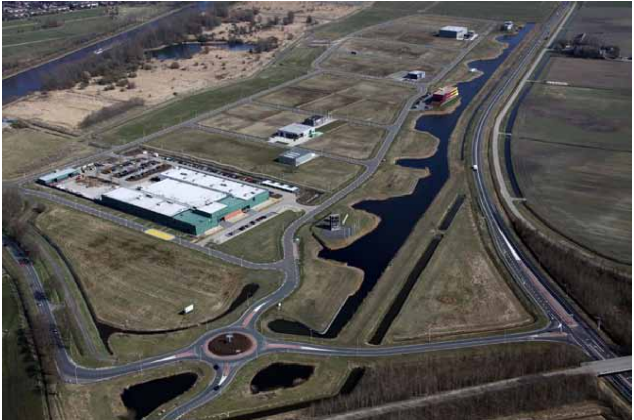
Nieuwe duurzame bedrijventerrein Fivelpoort bij Appingedam

ven zuidoost kansen voor logistieke bedrijven die niet direct achter een kade dienen te zitten. Kaderuimte en bedrijfsterrein achter de kade blijft hiermee in de toekomst beschikbaar voor bedrijven die wel direct afhankelijk zijn van scheepstransport.