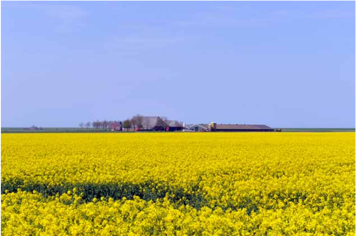
Koolzaadveld Noord Groningen

De sector landbouw heeft zelf vraagtekens bij de kansen, die de biobased economy hun op het moment biedt. In het landbouwactieplan Hoogeland ziet men tot aan 2020 weinig mogelijkheden, omdat de boeren de restproducten voor een deel zelf verwerken voor behoud en vergroten van de bodemvruchtbaarheid (b.v. het verhakselen van de stro). De biobased economy zal daarmee tot die tijd grotendeels afhankelijk zijn van de aanvoer van importbiomassa door de zeehavens.