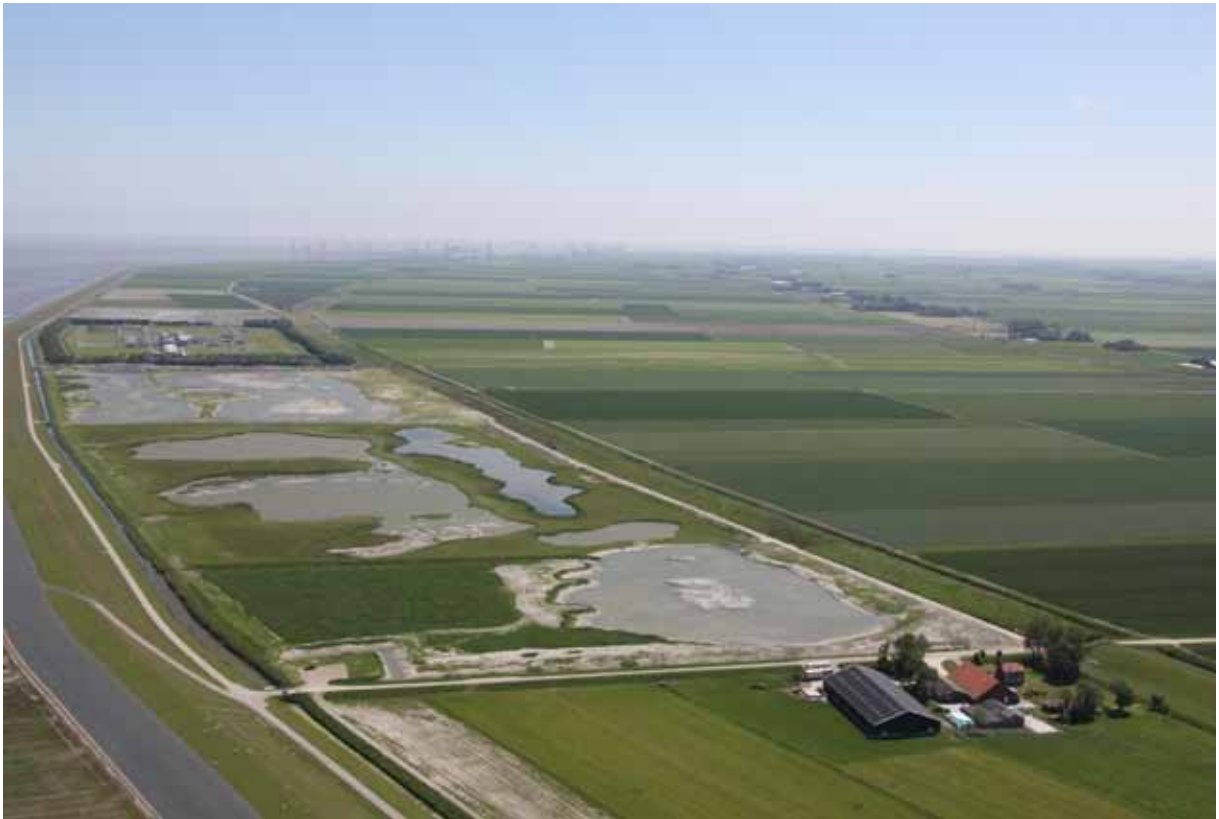
Natuurcompensatie bij het Uithuizerwad